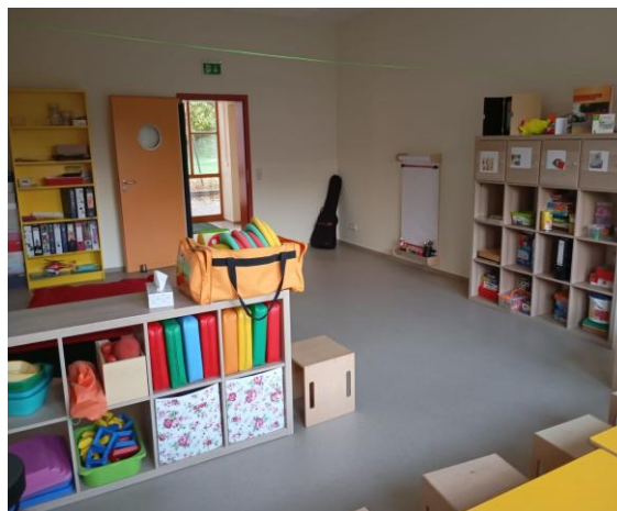
Schlaf- und Funktionsraum der Füchse: