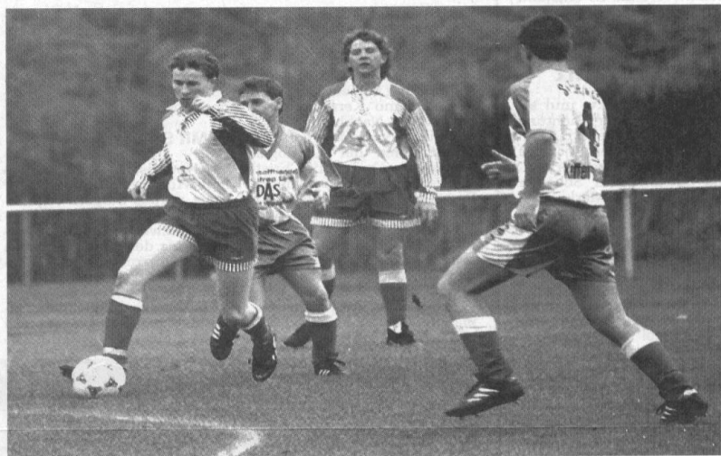
Eine spannende Saison boten die Kicker der Staffel II der 2. Kreisklasse. Unser Foto zeigt eine Szene der Begegnungen Geisleden/Kreuzebra II gegen Kefferhausen.

Fünf rote Karten gab es in dieser Saison. Erfreulicher Weise ein Rückgang von neun