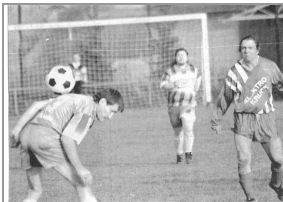
Sämtliche Tricks müssen die Kicker von Werratal Wahlhausen, hier beim Spiel in Heuthen, aus-schöpfen, wollen sie gegen Wüstheuterode/Mackenrode II erfolgreich sein.